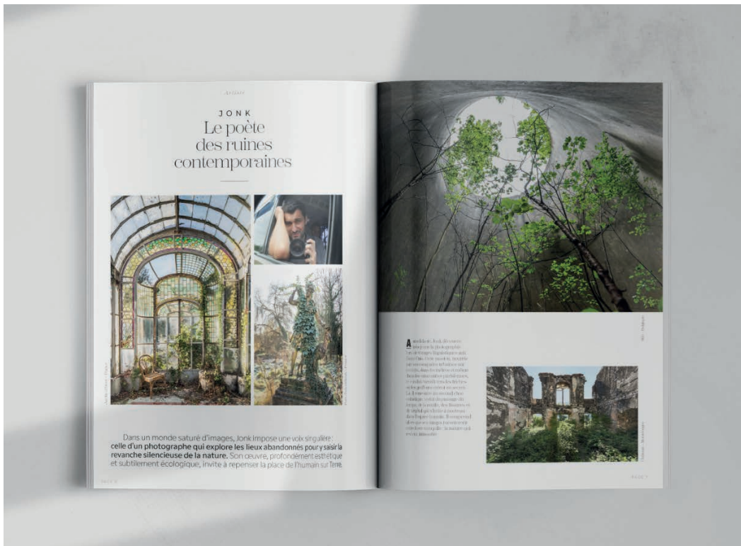
Exemple de mise en page Rubrique Artiste

NOVEA Magazine cultive un positionnement résolument Haut de Gamme : imprimé sur un papier d'une élégance rare, il est un support raffiné destiné à sublimer vos plus belles réalisations. »