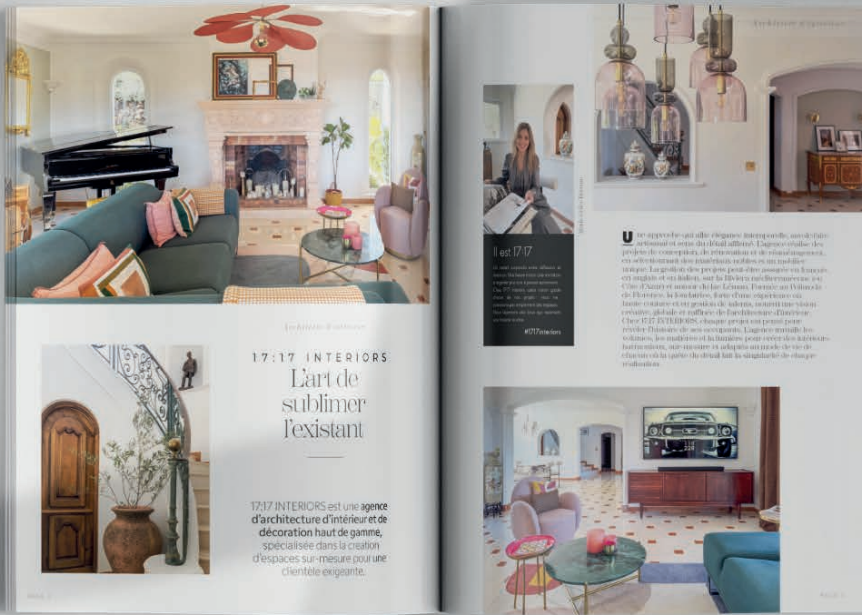
Exemple de mise en page Rubrique Architecte

NOVEA Magazine cultive un positionnement résolument Haut de Gamme : imprimé sur un papier d'une élégance rare, il est un support raffiné destiné à sublimer vos plus belles réalisations. »